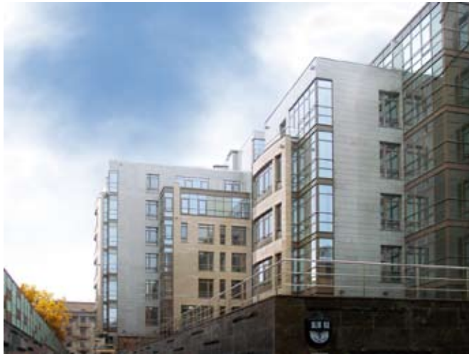
Aston Graftio, 23 asuntoa