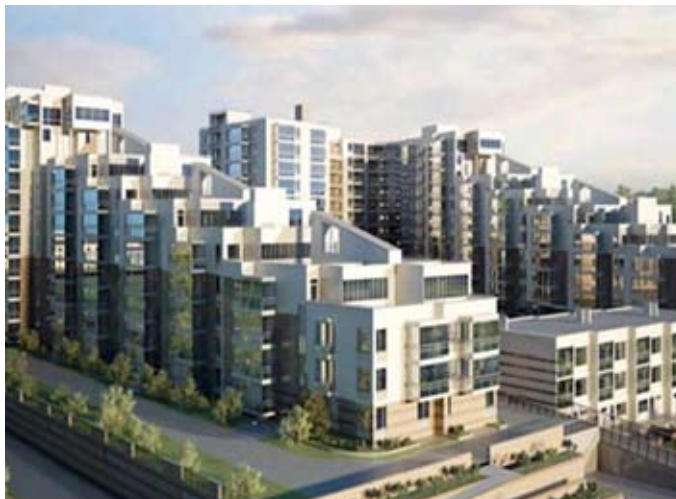
Karpovka, 42 asuntoa