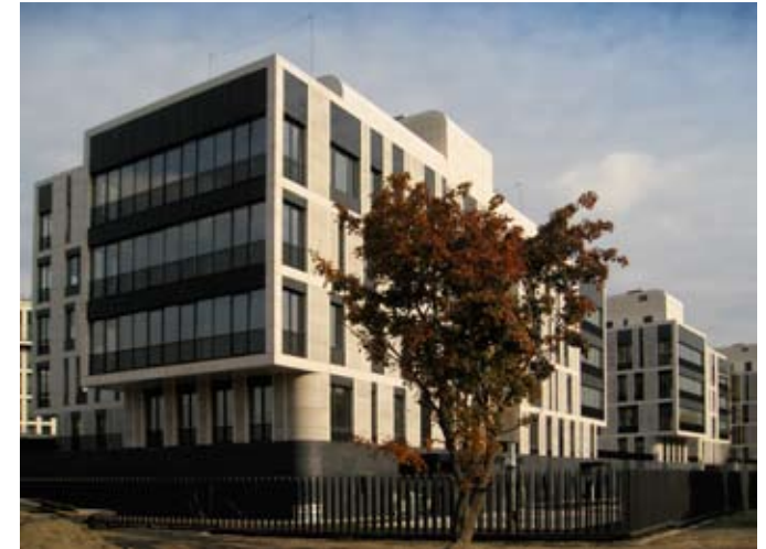
Martinova, 2 asuntoa