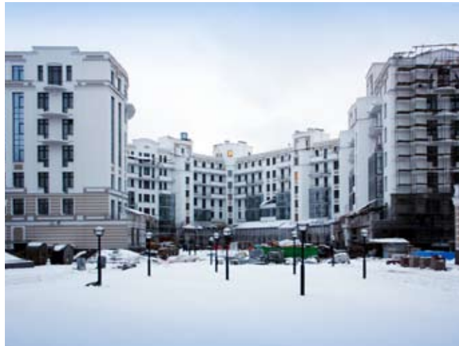
Morskoy 1 ja 2, 15 asuntoa