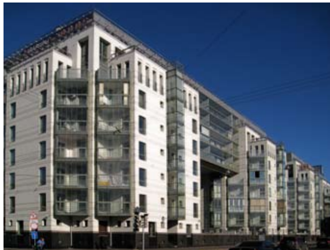
Shpalernaja 60, 11 asuntoa